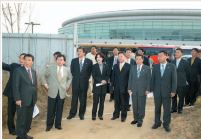
김천 실내수영장 건립 현장 ▶