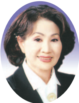
한 헤 련 간사(비례)