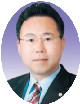
김 진 기의원(영덕)