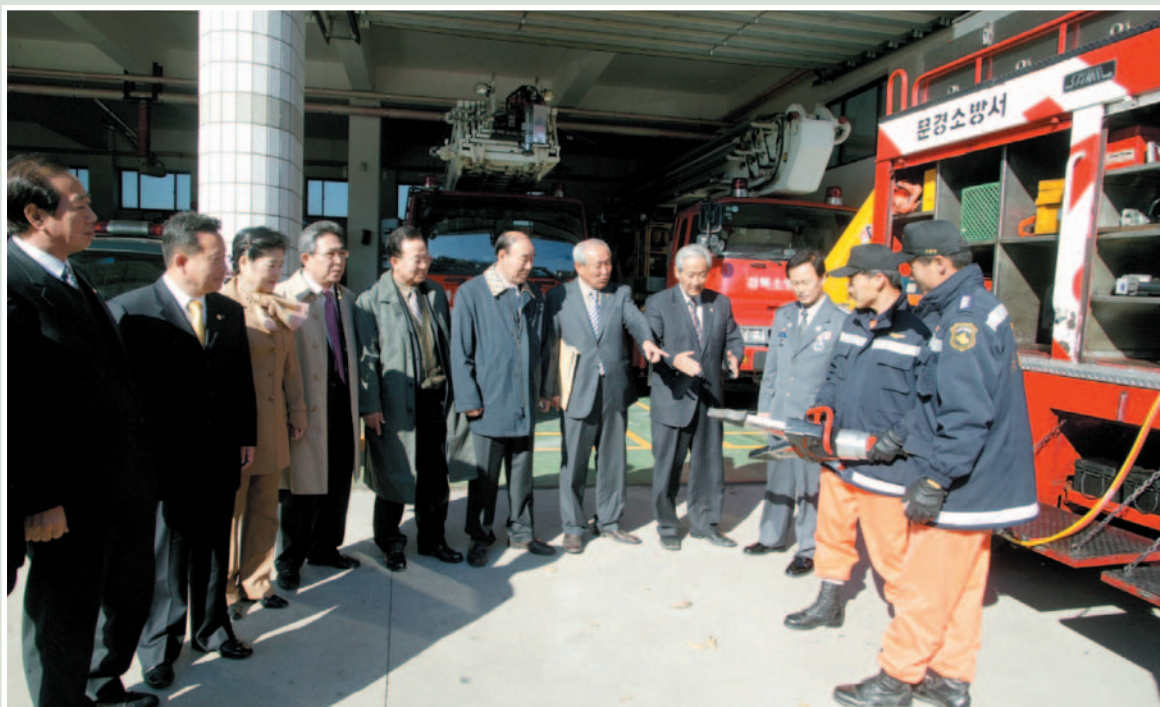
▲ 2005년도 행정사무감사(문경소방서)