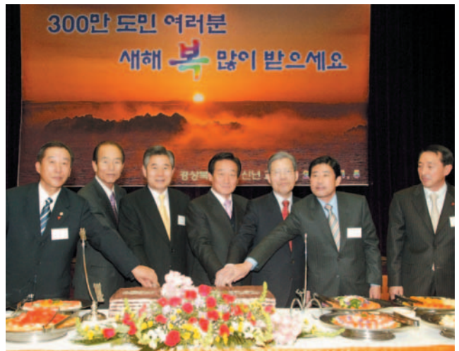
▲ 2006 경상북도의회 신년교례회