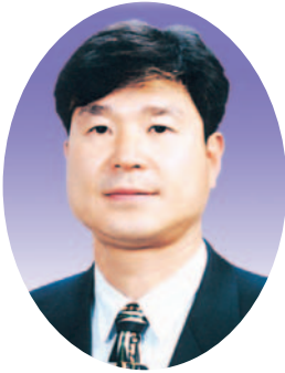
김 기 홍의원(영덕)