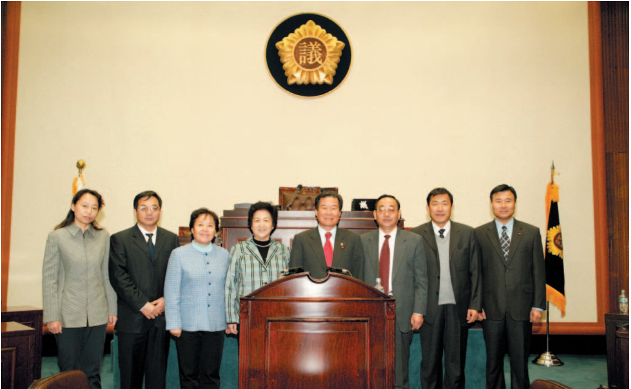
▲ 중국내몽고 부주석 방문