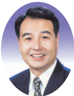
김 선 종 의원(안동)