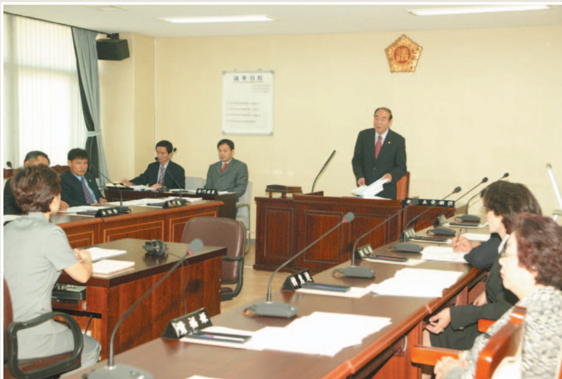
▲ 2005 행정사무감사(의회사무처)