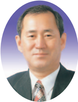
신 영 호 의원(의성)