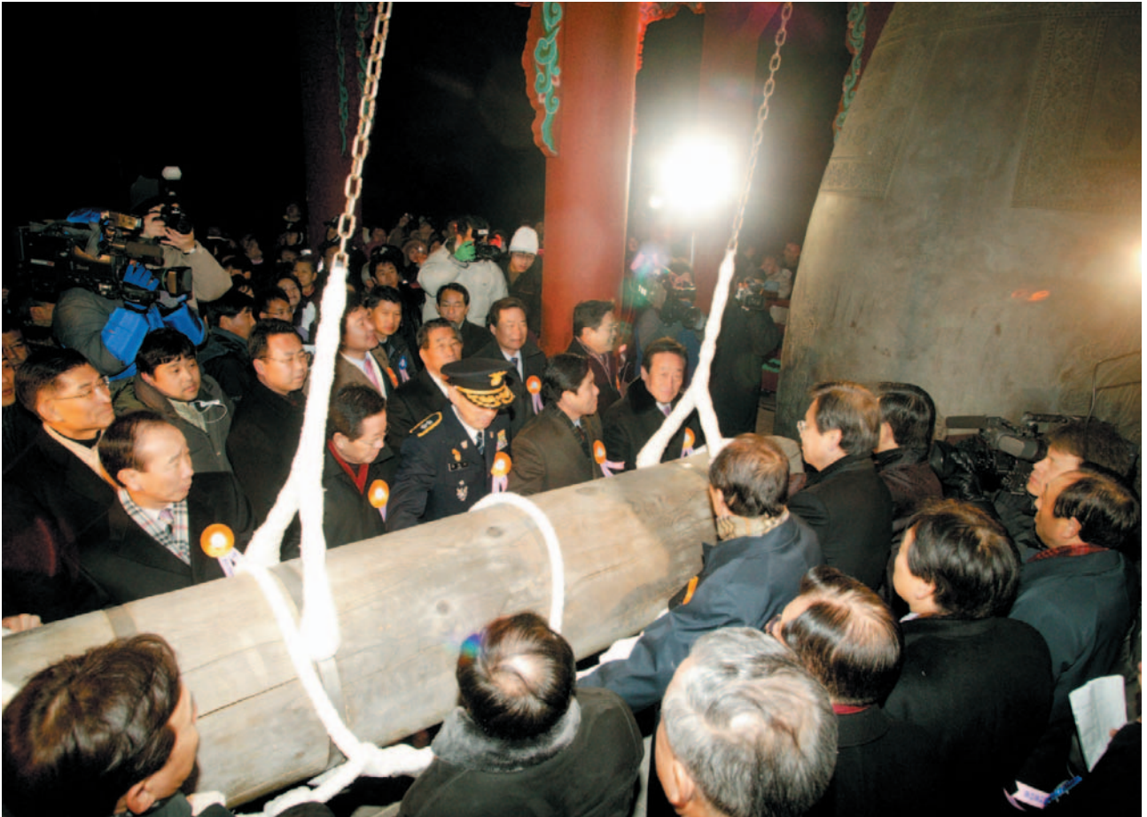
▲ 2005 제야의종 타종식(영덕)