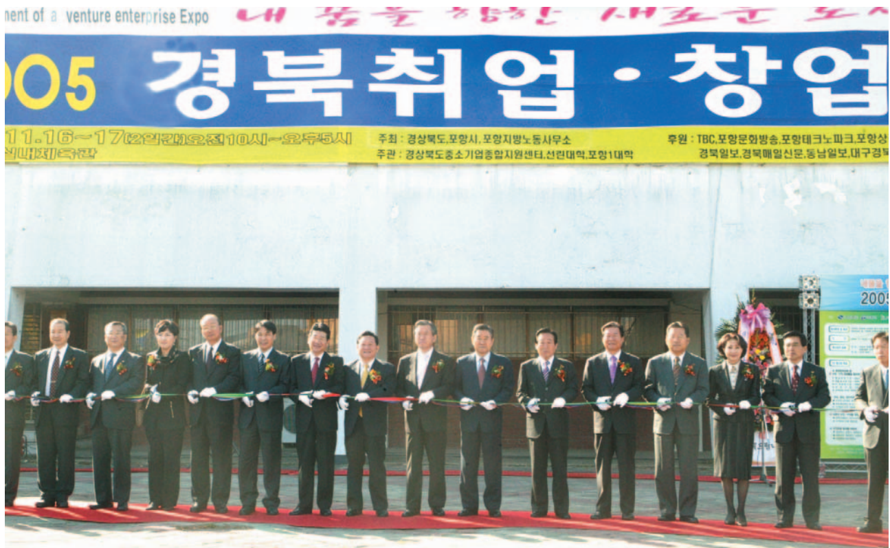
▲ 2005 경북취업·창업 박람회