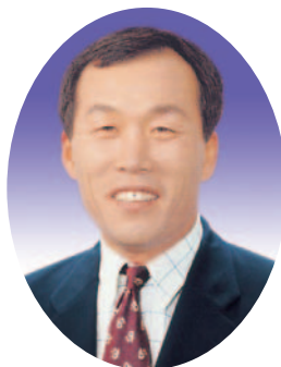
김 희 문의원(봉화)