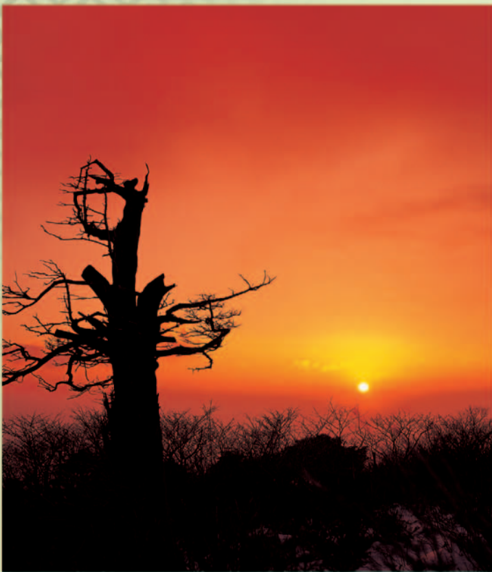
표지사진 : 태백산 일출