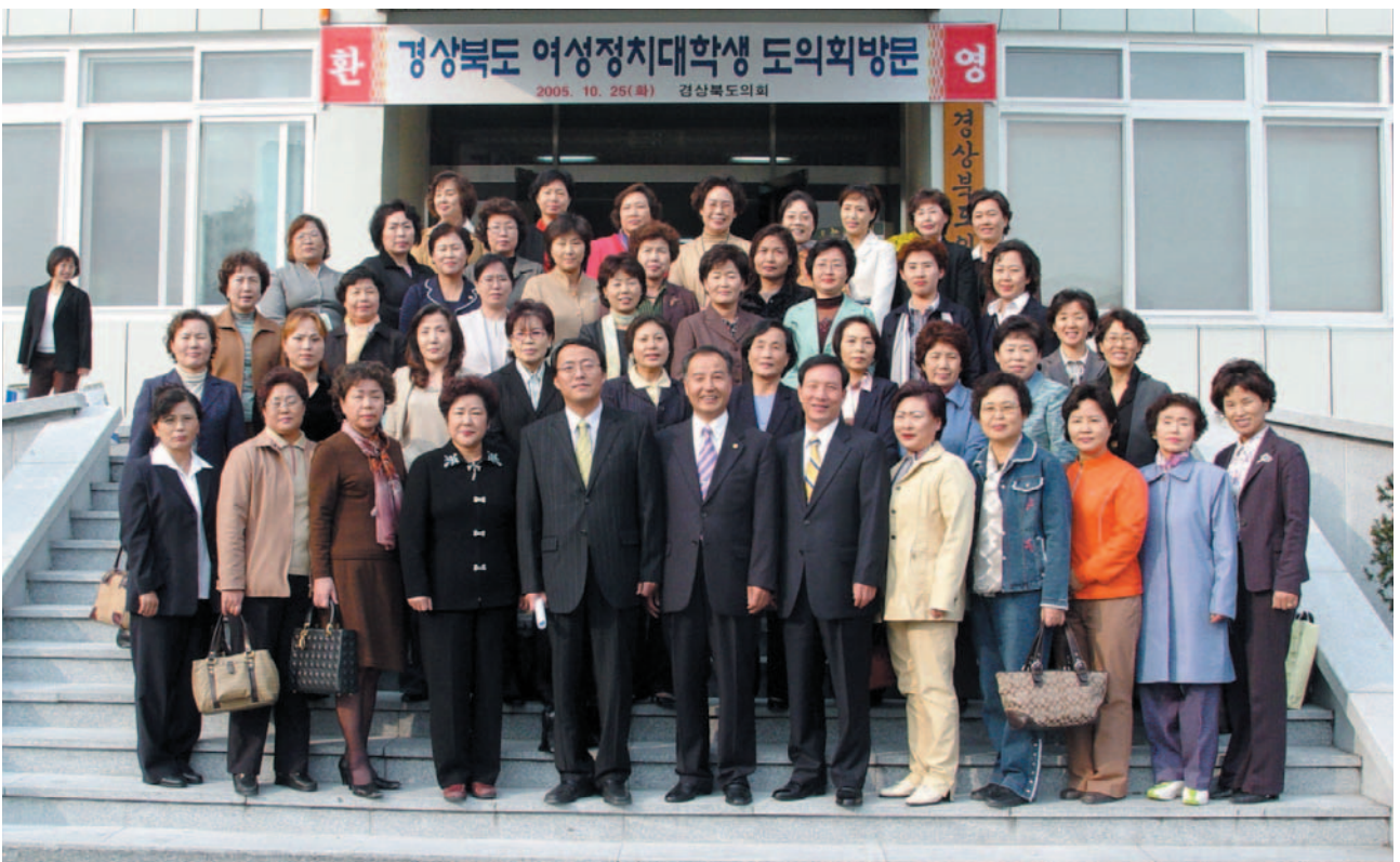
▲ 경상북도 여성정치대학생 도의회 방문