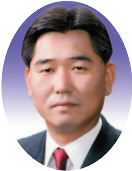
방 대 선위원장(성주)