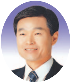
우 성 호 의원