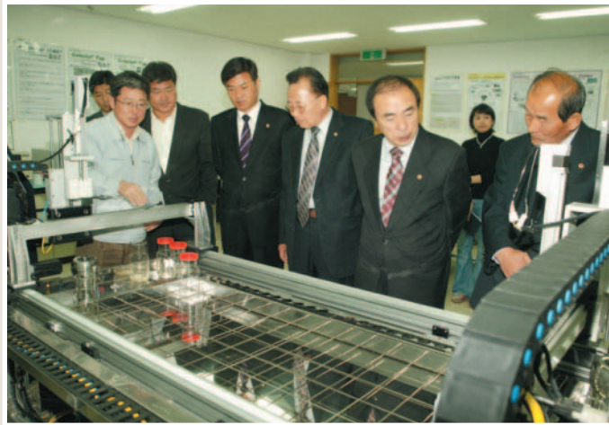
▲ 경북 테크노파크 현지확인