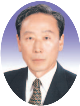
권 경 호 의원(영양)