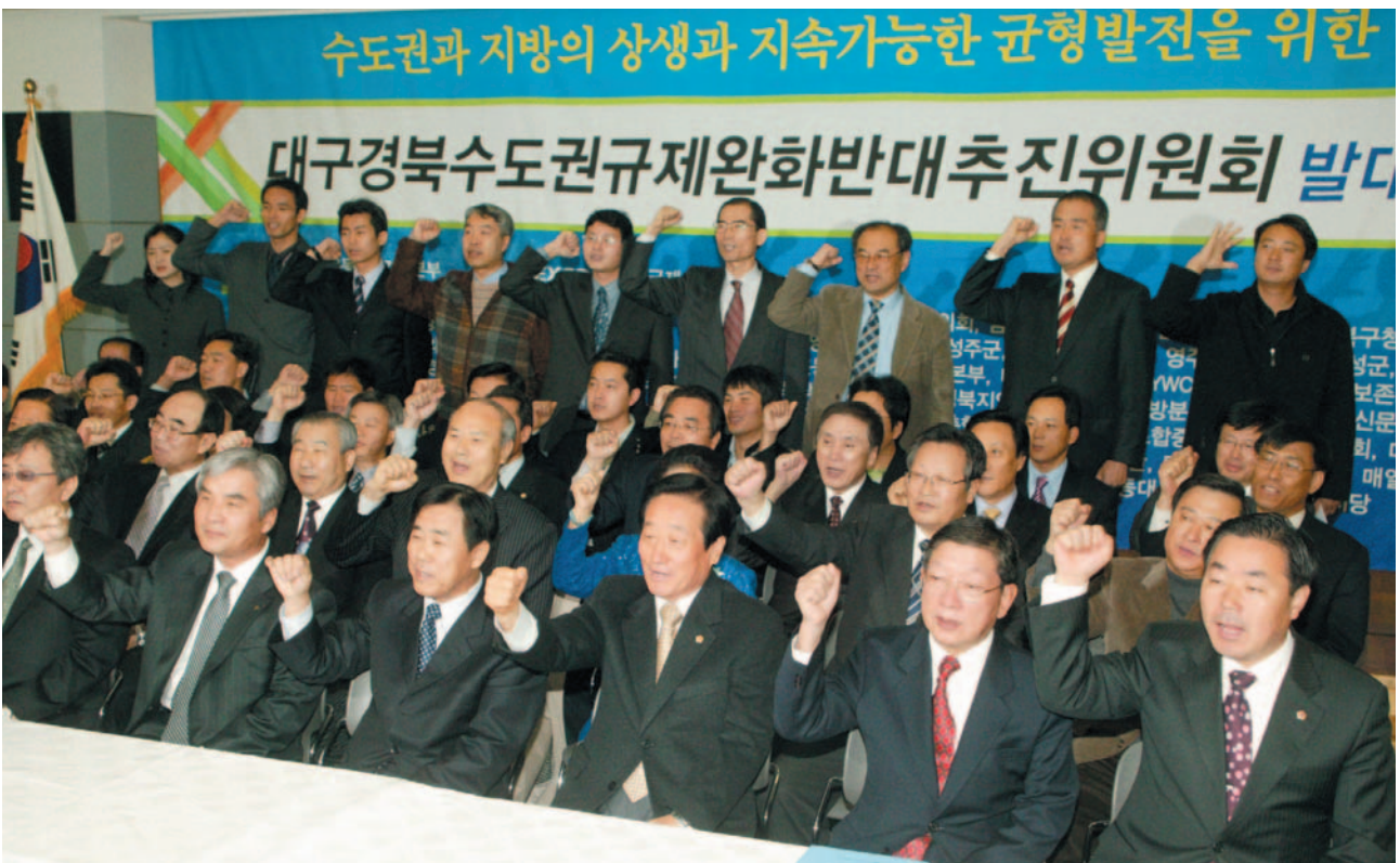
▲ 대구경북수도권규제완화반대추진위원회 발대식