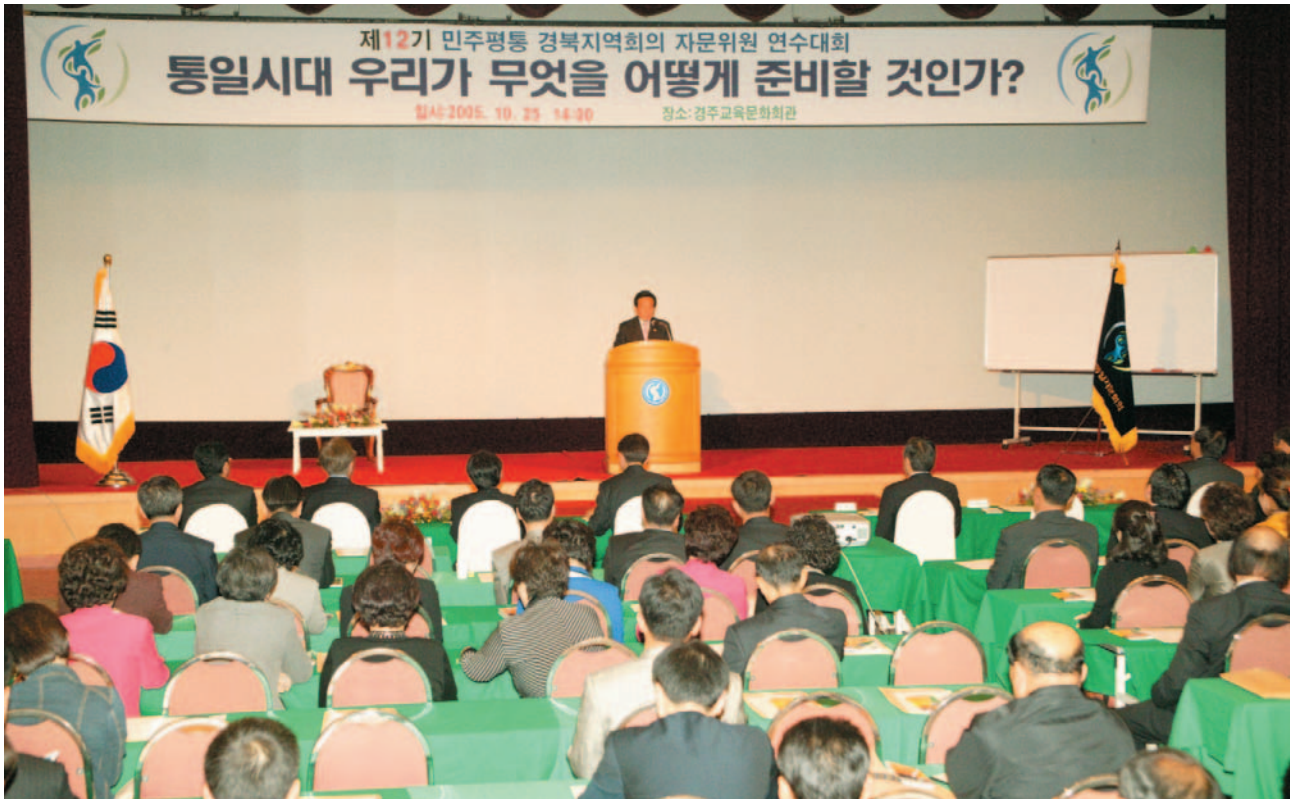
▲ 민주평통 경북연수대회