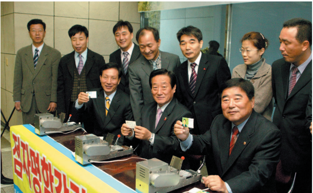
▲ 점자명함 제작