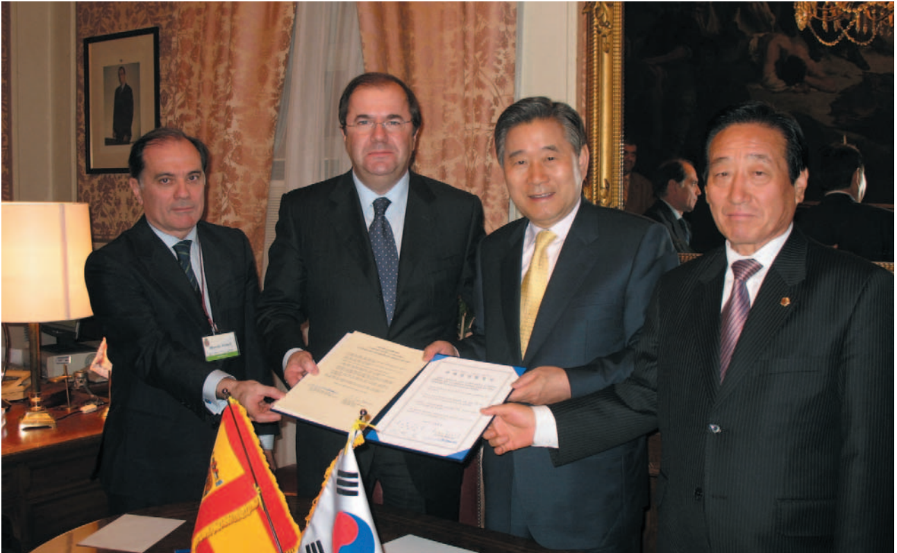
▲ 스페인 까스띠야레 방문