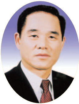
김 정 기의원(김천)