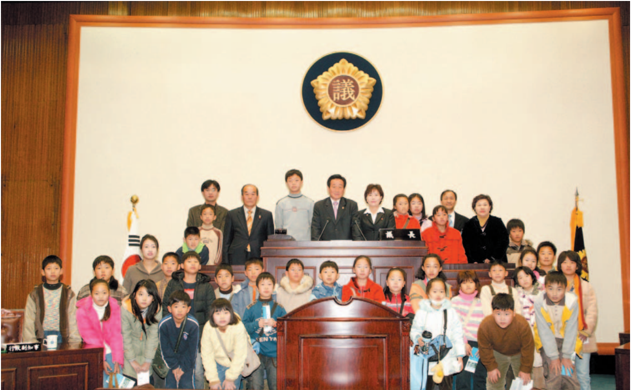
▲ 유천초등학교 의회 방문