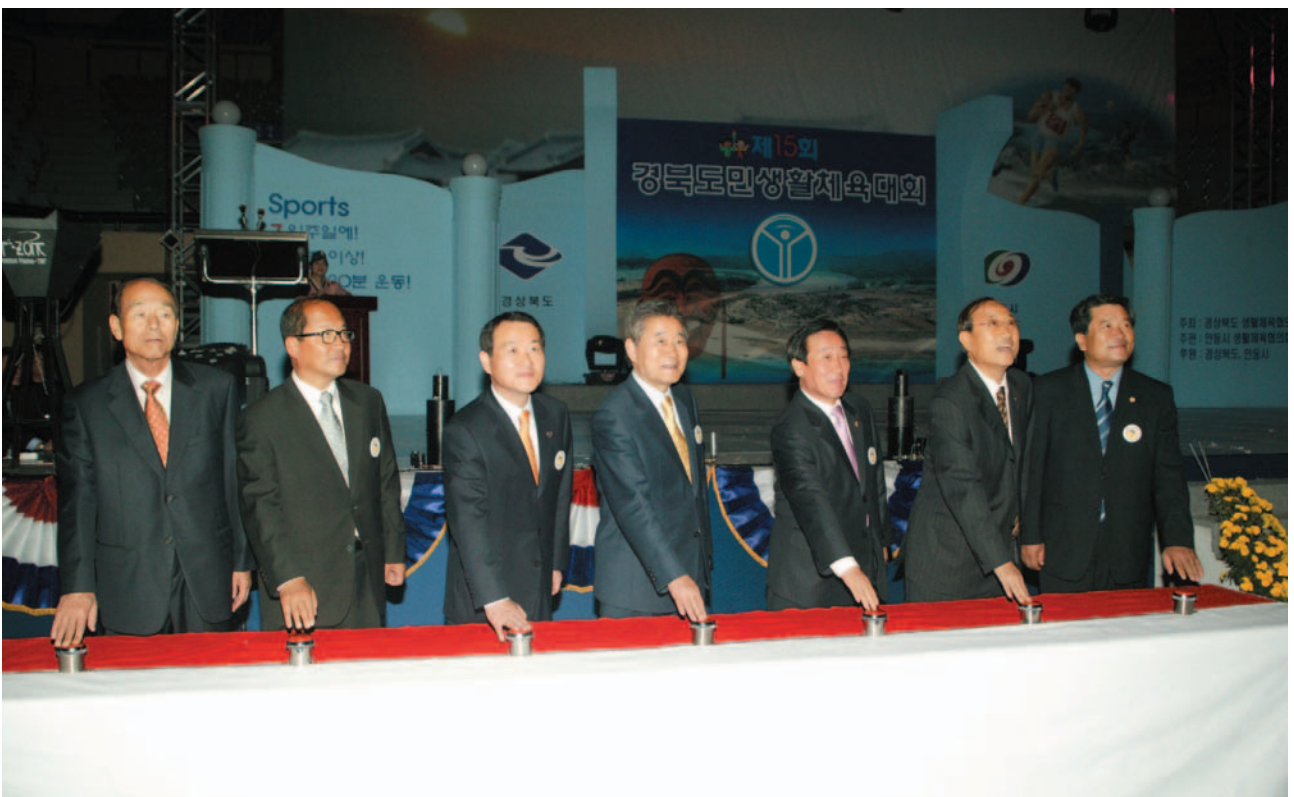
▲ 제15회 경북도민생활체육대회