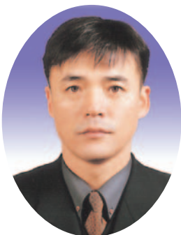
윤 경 희의원(비례)