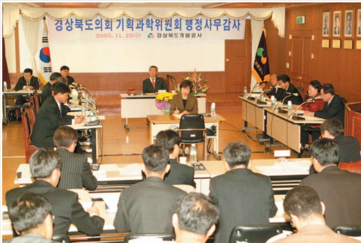
▲ 2005 행정사무감사(경상북도개발공사)