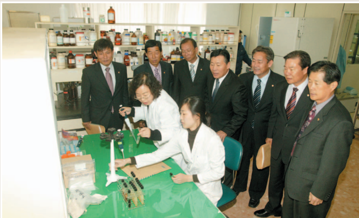
▲ 2005년도 행정사무감사(생물자원연구소)