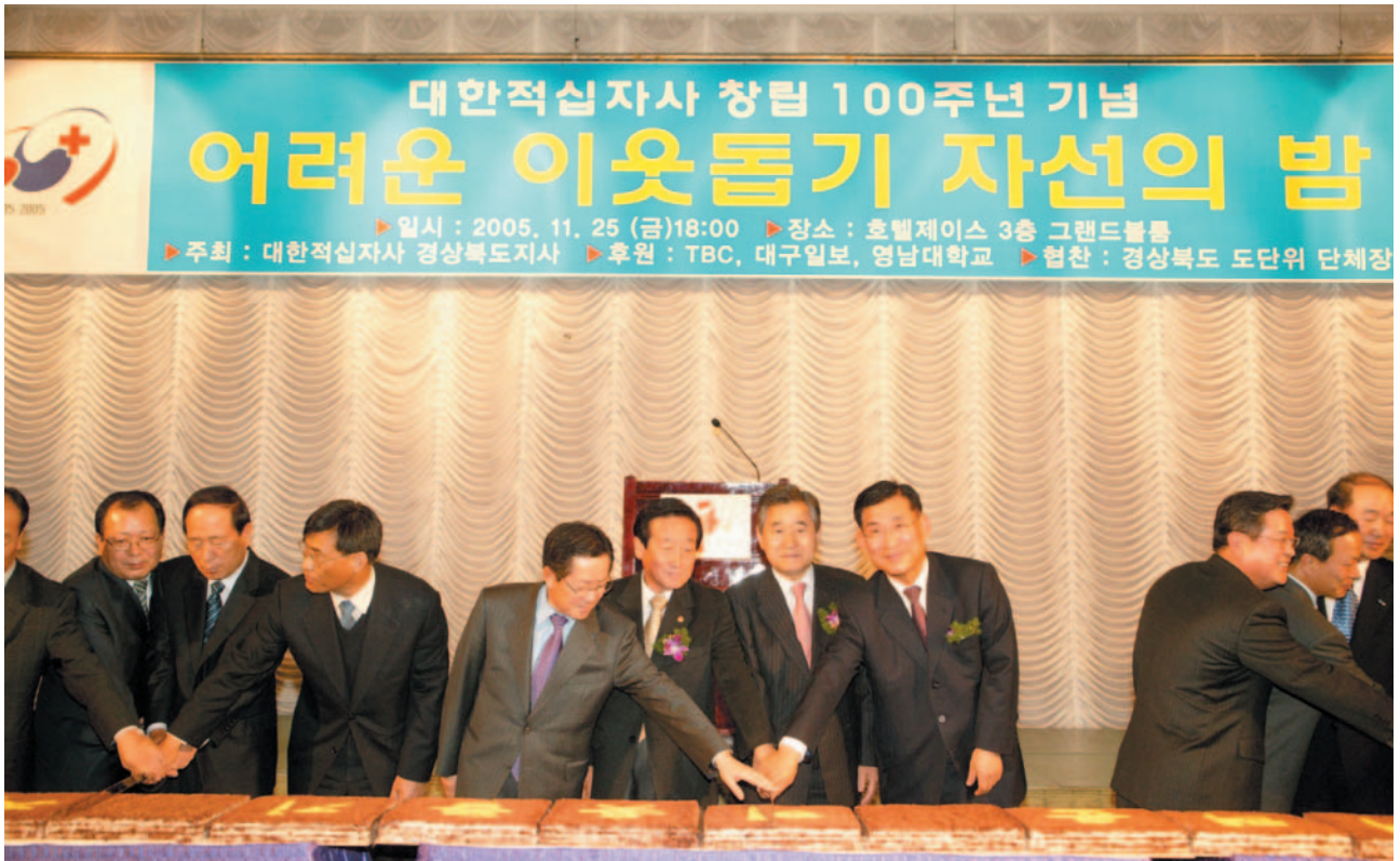
▲ 적십자 창립기념 자선의 밤