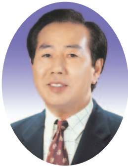
이 호 근의원(영양)