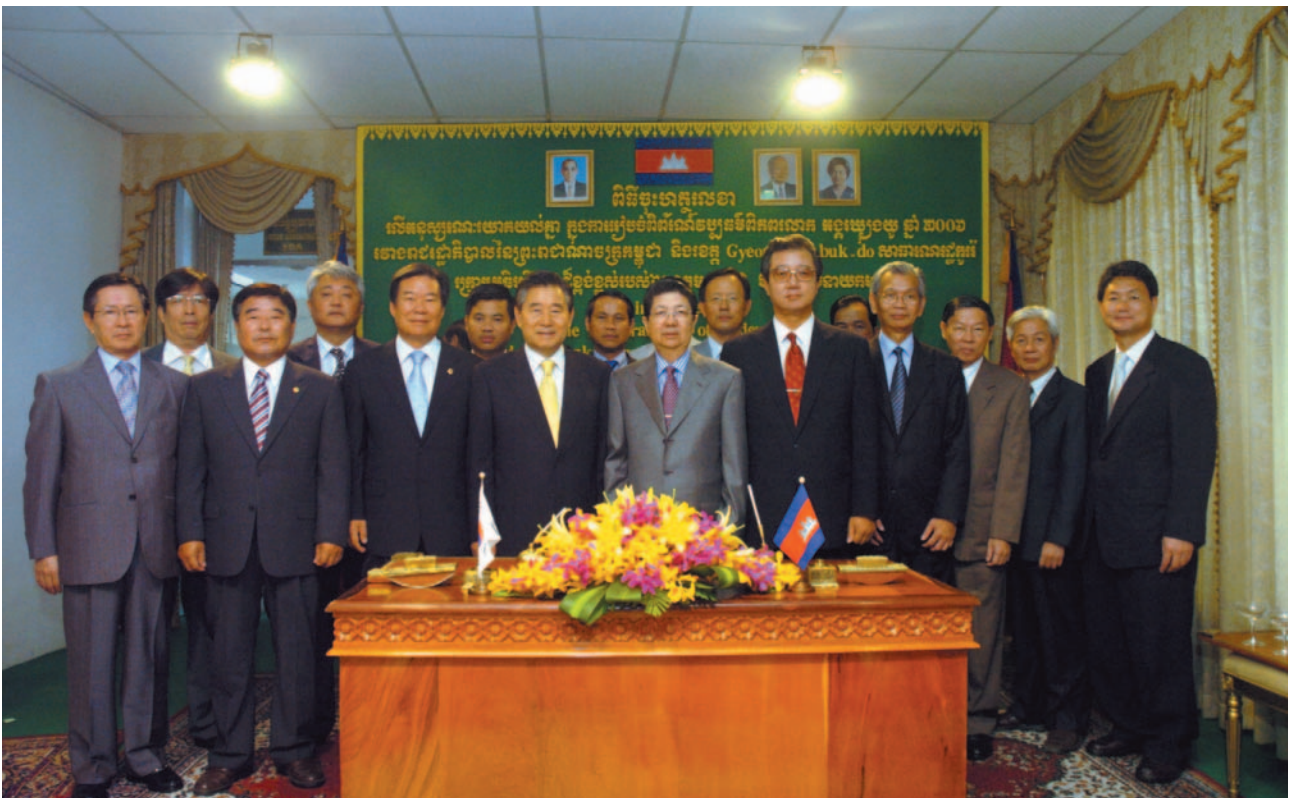
▲ 양코르-경주세계문화엑스포 양해각서 체결