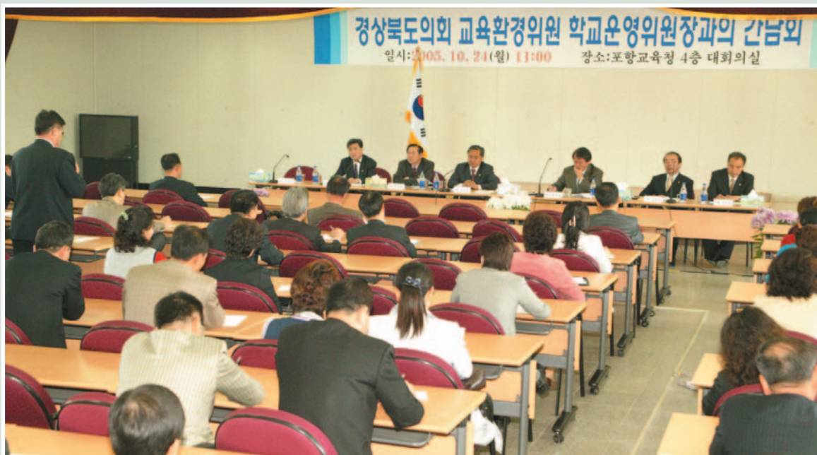
▲ 학교운영위원장과의 간담회(포항교육청)