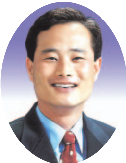
장 대 진 의원(안동)