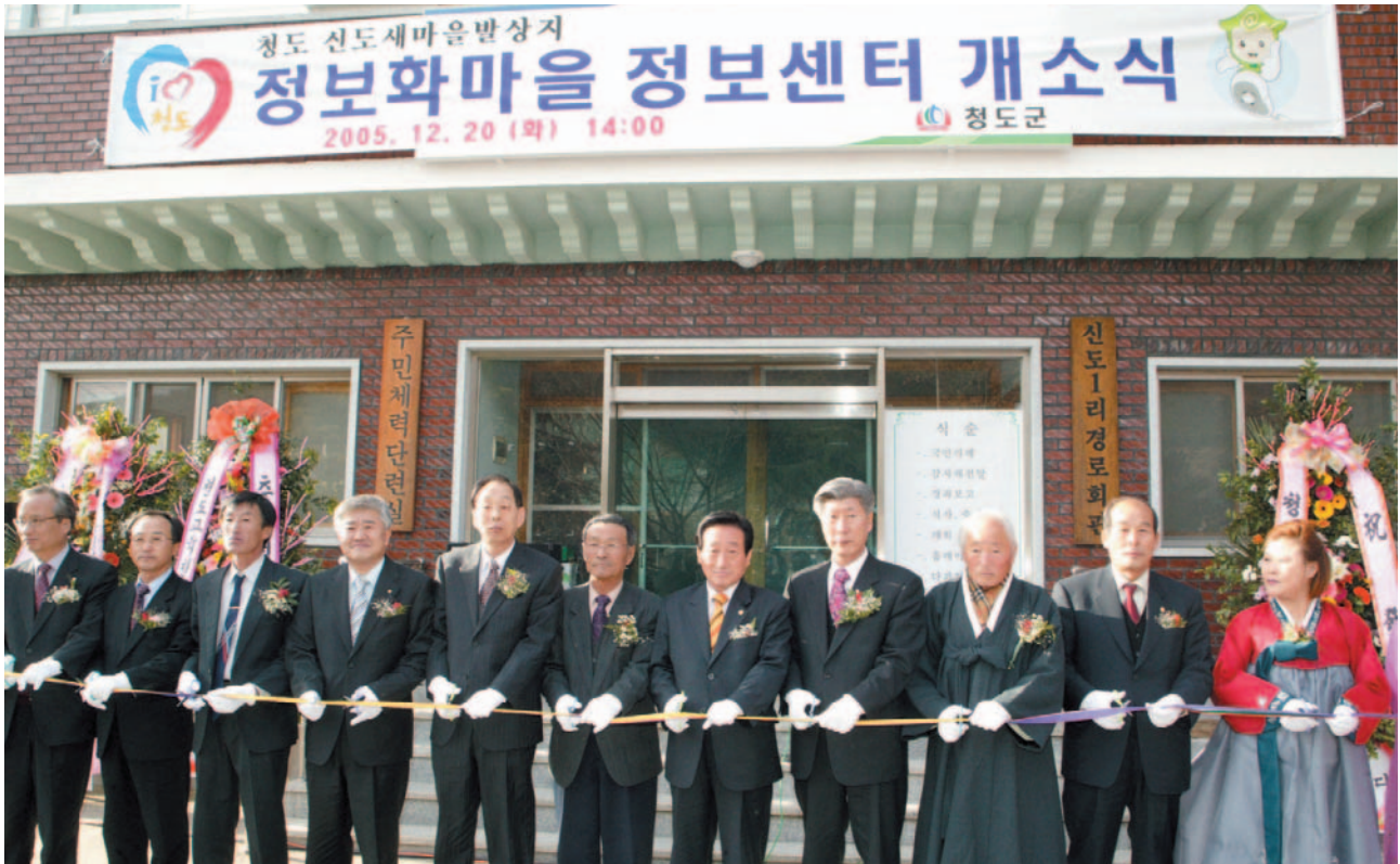
▲ 청도 신도 정보화마을 정보센터 개소식