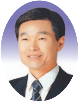
우 성 호의원(영주)