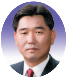
방 대 선 의원