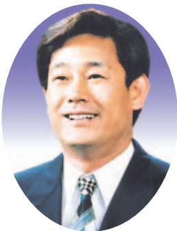
방 유 봉의원(울진)