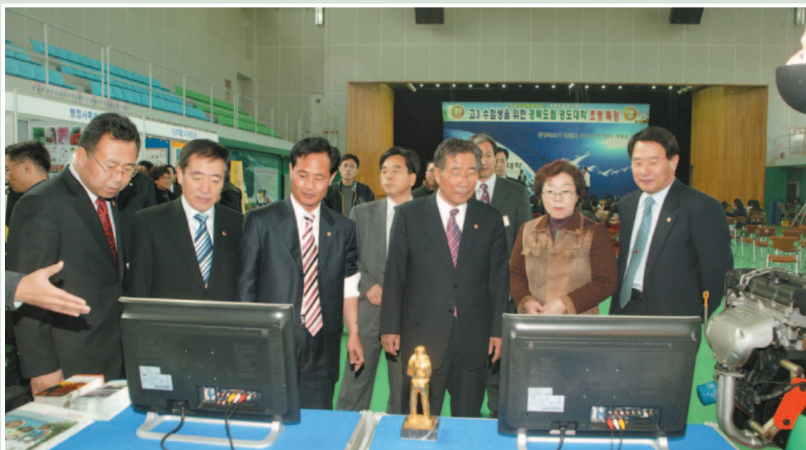
▲ 2005년도 행정사무감사(경도대학)