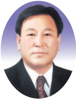
임 원 식의원(울진)