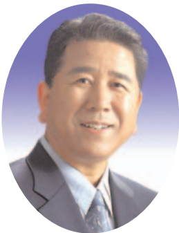
최 원 병의원(경주)