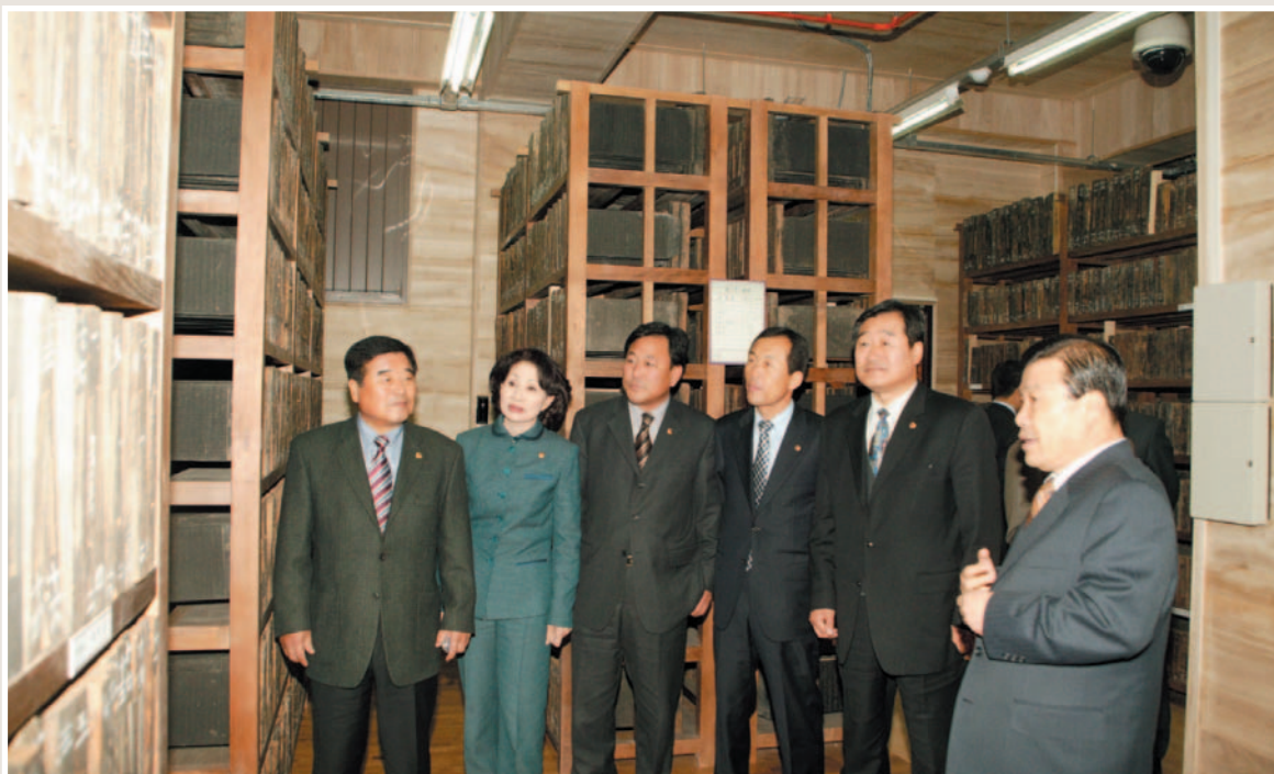
▲ 2005 행정사무감사(한국국학진흥원)