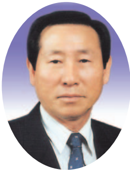
권 준 택 의원(칠곡)