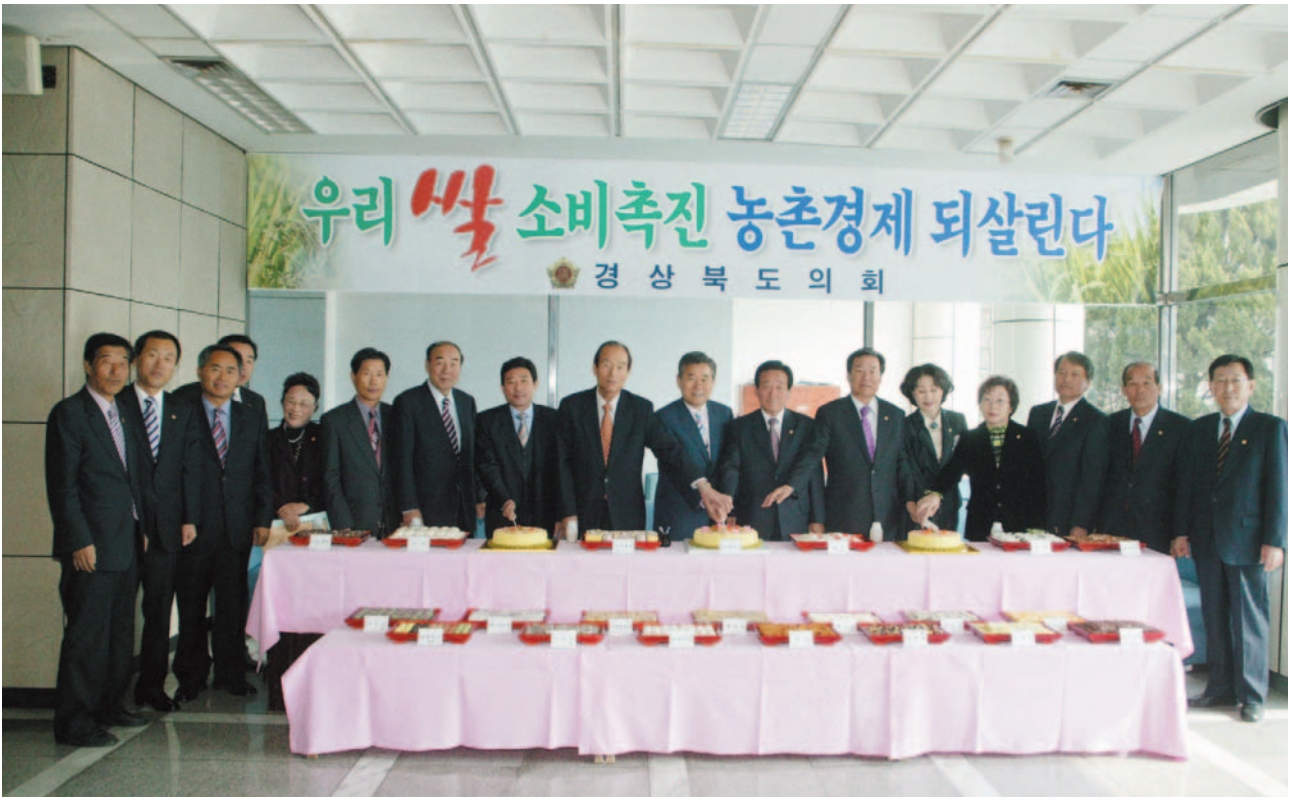
▲ 우리쌀 소비 촉진