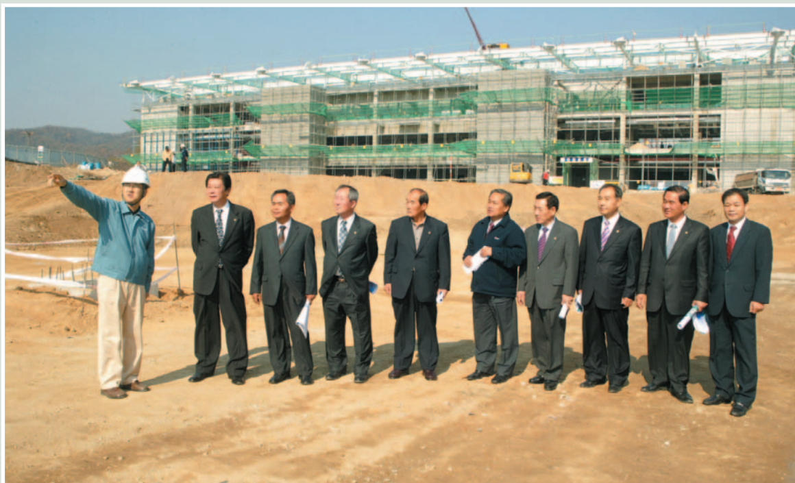
▲ 예산결산특별위원회 현지확인(김천)