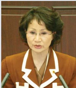
한 해 련 의원 통상문화위원회(영천)

답) 민선 4기가 출범하면서 러시아, 일본 등과의 경제교류를 증대하고 통일한국의 남북교역에 대비해 나가고 정부 개발방향을 U자형으로 바꾸기 위해 취임과 동시에 『동해안 해양개발 프로젝트』를 발표하고 구체화시켜 나가고 있음. 영천은 신산업 육성을 위한 입지성이 용이한 지역으로 이미 하이브리드 부품 기술혁신센터 건립을 추진하여 부품산업을 고부가가치산업으로 시행해 나가고 있으며 올해에는 50만평 규모의 지방산업단지를 착공하였으며, 지난 2월 안동에서 개최한 균형발전 2단계 보고회에서는 경제자유구역을 추가로 지정하겠다는 국가균형발전위원회의 발표가 있었음. 이에 따라 우리 道에서는 관련 전문가들로 추진팀을 구성하여 정부의 정책방향을 면밀히 분석하고 있으며, 앞으로 여건이 가능한 지역을 중심으로 경제자유구역 지정을 추진해 나갈 계획임.